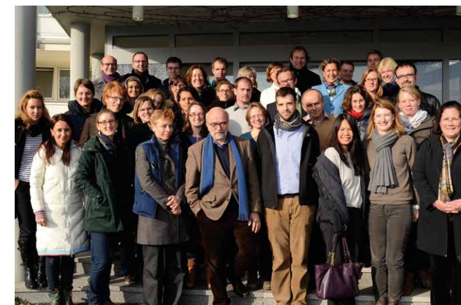
Los empleados del instituto a finales de 2013

El estudio sobre Afghanistan tiene el carácter de un así llamado Desk Review (una revisión) sobre las evaluaciones ya realizadas y la verificación de efectos de programas financiados por el BMZ. La respectiva publicación está prevista para mayo de 2014.