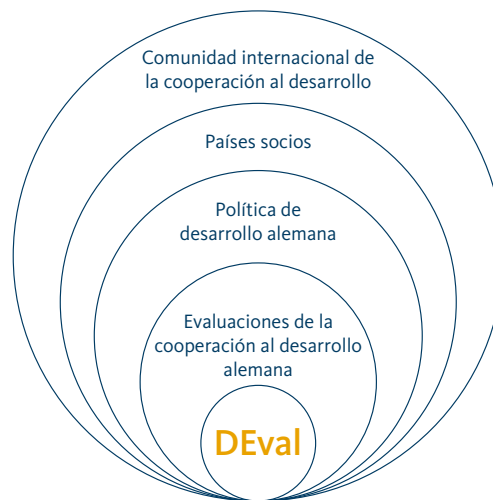
El DEval en el contexto internacional

En julio de 2014, DEval se encargará del proyecto FOCEVAL (fomento de capacitación en evaluación) de ECD en Costa Rica.